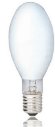
LÂMPADA VAPOR DE SÓDIO 250W OVOIDE - ROSCA E-40